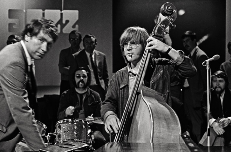
Bassist Arjen Gorter

– zeker vergeleken met de miljoenen voor klassieke muziek – draagt toch bij tot het scheppen van een buitengewoon vruchtbaar artistiek klimaat.