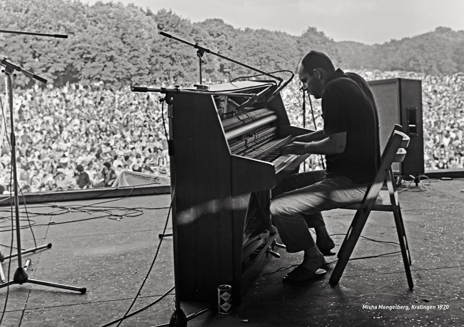
Misha Mengelberg, Kralingen 1970